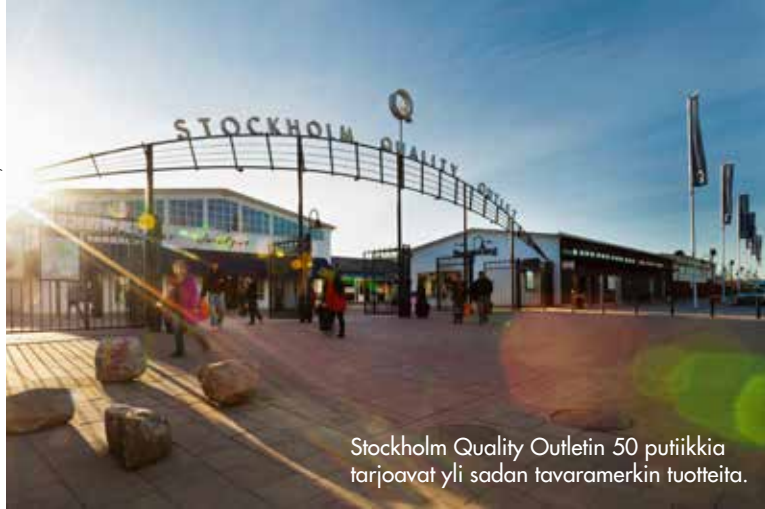
Stockholm Quality Outletin 50 putiikkia tarjoavat yli sadan tavaramerkin tuotteita.