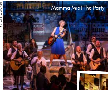
Mamma Mia! The Party