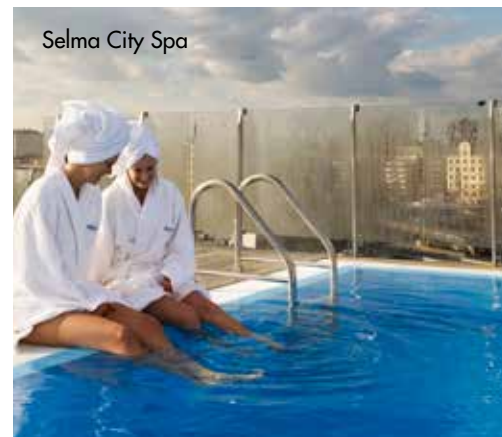
Selma City Spa

ELITE HOTEL MARINA TOWER on vanhan myllyn tiloihin rakennettu uusi upea hotelli, joka